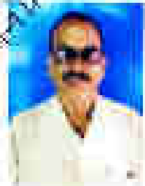
आशीर्षित उत्तर प्रदेश गैर न्यायिक न्यायालय आशीर्षित