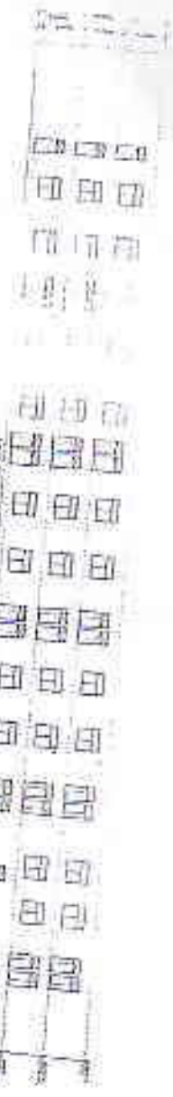
FIRST FLOOR PLAN