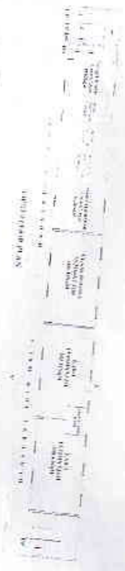
THIRD FLOOR PLAN