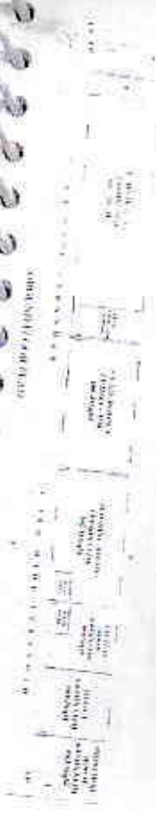
FOURTH FLOOR PLAN