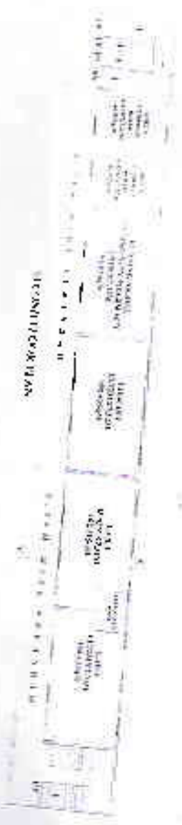
SECOND FLOOR PLAN