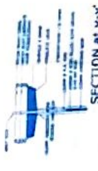
SECTION AT Y-Y'