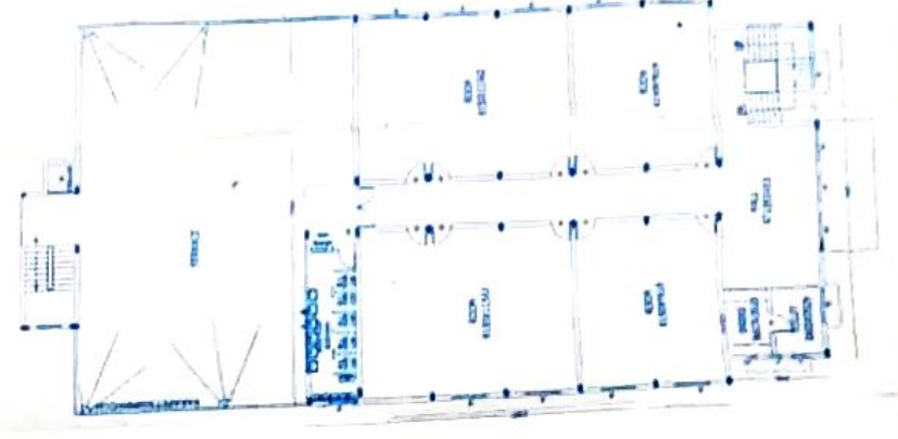
SECOND FLOOR PLAN