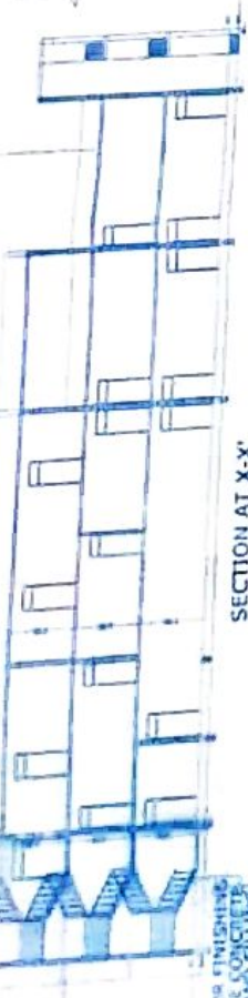
SECTION AT X-X'

0.075M THICK RAJES TILT OVER 0.05M THICK MID FINISH OVER 7 LAYERS OF HOT BITUMEN OVER 0.11UM THICK E.C. SLAB