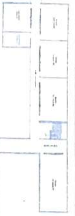
GROUND FLOOR PLAN

Notes and specifications are given in the schedule