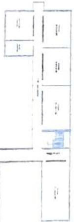
SECOND FLOOR PLAN