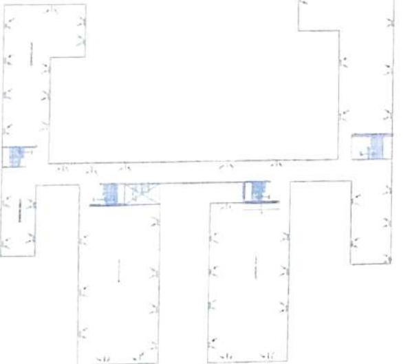
TOP FLOOR PLAN