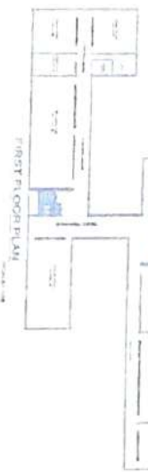
FIRST FLOOR PLAN