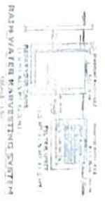
RAIN WATER HARVESTING SYSTEM